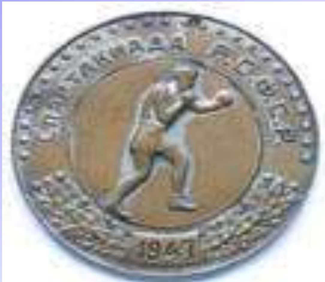
Спартакиада РСФСР 1947г. Бокс 2 место

Летом 1947 года была проведена Спартакиада республики, а лучшие спортсмены выступили на Спартакиаде народов РСФСР в Москве.