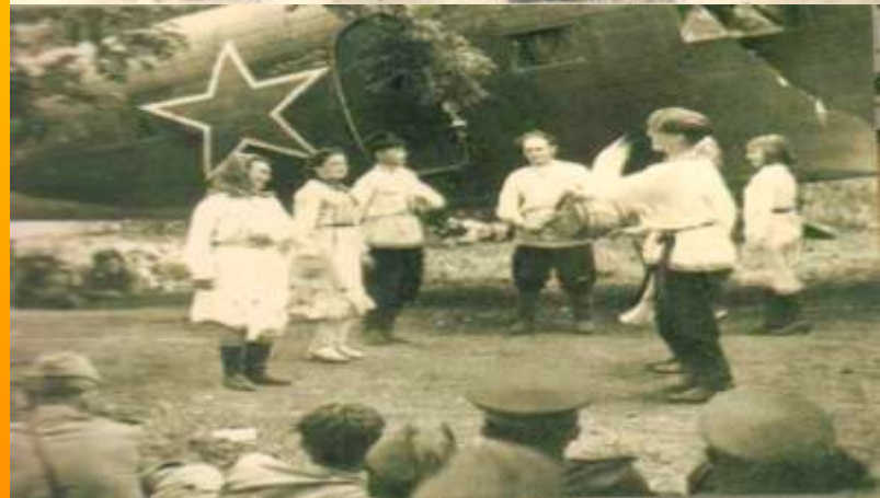
Концертная фронтовая бригада Маргосфилармонии