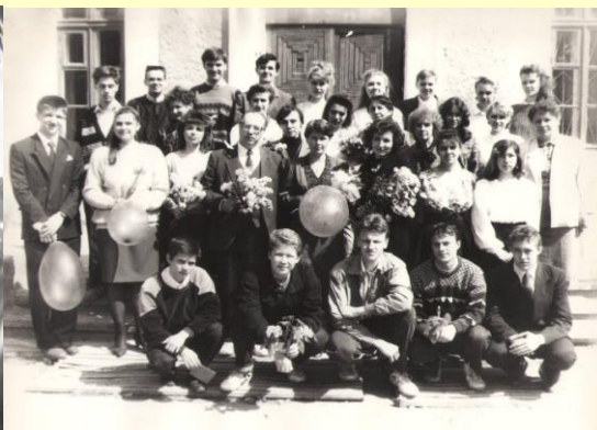
На первом фото первоклассники, втором - первые выпускники школы с учителями.